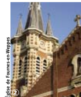
Église de Fournes-en-Weppes

A la frontière des Flandres, découvrez un village qui garde intacte sa culture rurale à tradition agricole tout en étant en phase avec l'urbanisation proche. Sans difficulté.