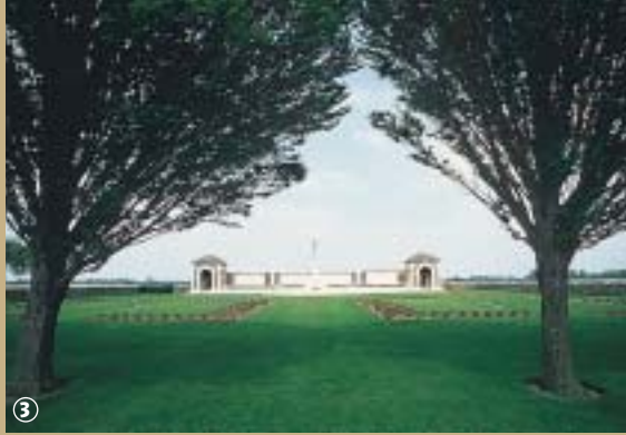
Cimetière militaire à Fromelles

Le Pays de Weppes, quartier de l'ancienne châtelainie de Lille, situé à l'ouest de ladite ville, tient son nom du latin « ad vespas » qui signifie « fin de journée » et que l'on retrouve dans « vèpres », prière récitée en fin d'après-midi, au coucher du soleil.