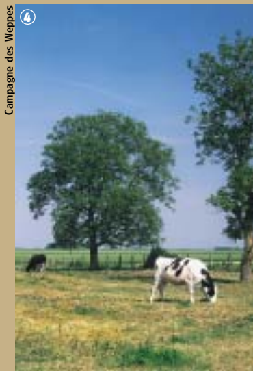
Campagne des Weppes

possède une forte identité bucolique et paysagère. D'ailleurs son patrimoine recense de nombreuses chapelles, granges et musées. Des monuments commémoratifs de la Grande Guerre ainsi qu'un nombre important de cimetières militaires de soldats venus parfois de pays lointains comme les Indes, l'Australie, la Nouvelle-Zélande ou les Etats-Unis, rappellent que les guerres, à toutes les époques, ont ravagé les lieux. Mais, fort heureusement, bois et boqueteaux viennent rythmer le paysage de cette charmante contrée qui a su renaître de ses cendres !